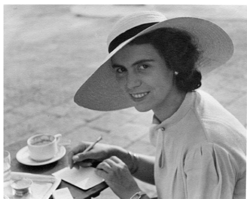
Hilde Lotz-Bauer, um 1935 in Venedig, © Familie Lotz

Die Fotografin und promovierte Kunsthistorikerin Hilde Lotz-Bauer (1907 München - 1999 München) lebte von 1935 bis 1943 in Italien. Das Kunsthistorische Institut in Florenz besitzt durch Schenkung und durch Ankauf in den 70er und 80er Jahren einen Teil ihres künstlerischen Nachlasses in Form von ca. 750 Fotos, von denen eine repräsentative Auswahl aus Anlass ihres hundertsten Geburtstags jetzt erstmals in einer Online Ausstellung gezeigt wird.