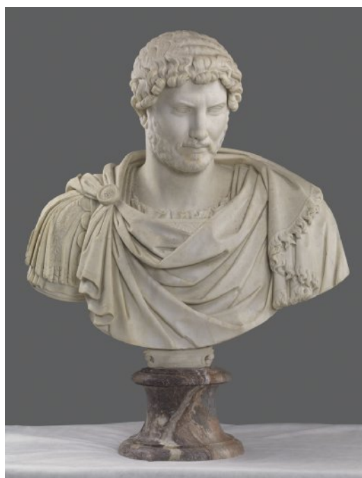
Büste des Kaisers Hadrian, 2.Jh. n. Chr., Marmor, Florenz, Boboli-Garten, Stanzonaccio