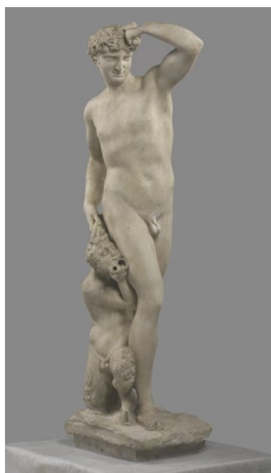
Vincenzo Rossi, Bacchus mit Satyr, vor 1576, Marmor, Florenz, Boboli-Garten, Stanzonaccio; © Kunsthistorisches Institut in Florenz - Max-Planck- Institut