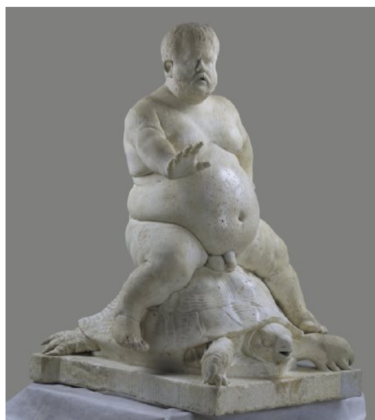
Valerio Cioli, Der Zwerg Morgante auf einer Schildkröte (unten Detail), 1561-1564, Marmor, Florenz, Boboli-Garten, Stanzonaccio