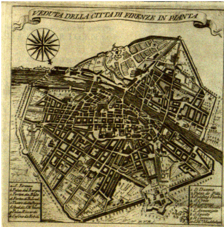
Veduta della citta di Firenze in pianta. Aus einem Führer um 1670, Kupferstich, Entwurf von Vannius, Stecher Bellon.